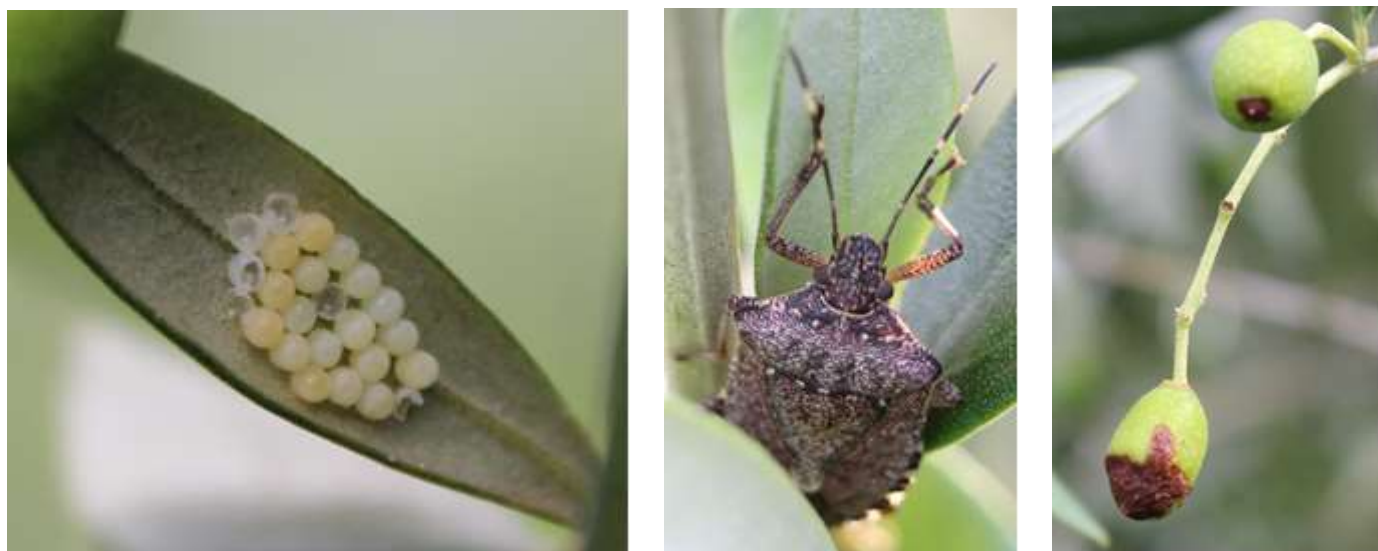
Fig. 6. Ovatura, Adulto e Cascola anomala

Gli adulti sono lunghi circa 1,7 centimetri e hanno la caratteristica forma a scudo. Caratteri di riconoscimento di questa specie, oltre alla colorazione scura, comprendono le bande luminose alternate sulle antenne e bande scure alternate sul bordo esterno dell'addome. Le zampe sono marroni con deboli chiazze bianche o strisce.