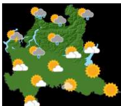
SABATO 06 LUGLIO