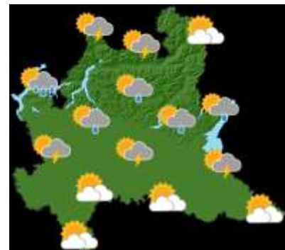
DOMENICA 07 LUGLIO

Le condizioni meteo appaiono caratterizzate da tempo stabile con possibili locali rovesci.