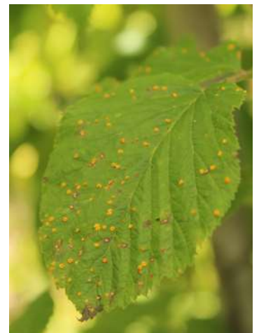
Fig. 3: Ruggine del lampone

ANTONOMO: questo insetto attacca principalmente fragola, lampone e mora. Il danno consiste nel recidere i boccioli fiorali che cadono anticipatamente. Si segnala la sua presenza in alcuni impianti e per tale ragione si consiglia di valutare la situazione in campo ed eventualmente intervenire con un prodotto insetticida.