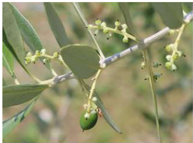
Fig. 5. allegagione

Si riscontrano in alcuni impianti, attacchi di occhio di pavone non particolarmente gravi. Si consiglia di prestare attenzione nelle zone con impianti fitti e scarsa circolazione d'aria. Si consiglia di intervenire con un trattamento a base di Rame , terminata la fioritura.