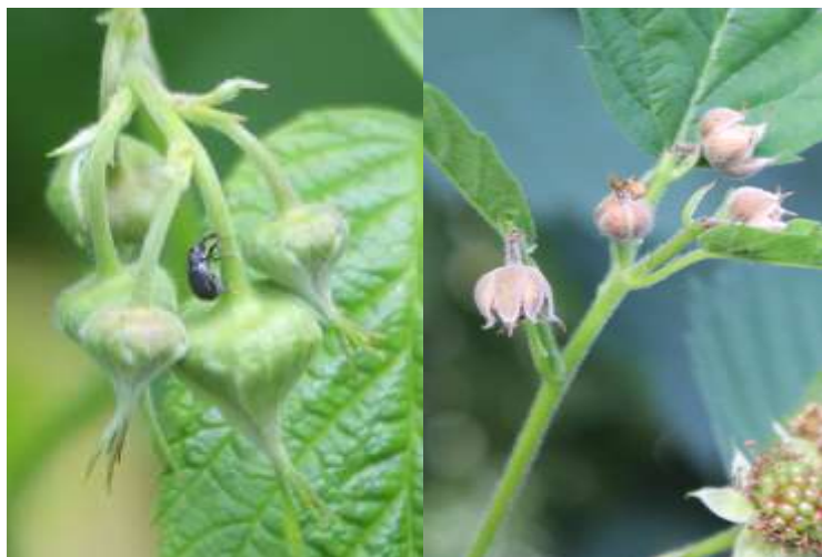
Fig. 4. A destra adulto di Antonomo, a sinistra Danni con recisione dei boccioli fiorali