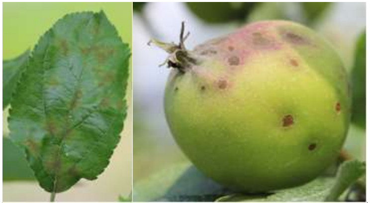
Fig. 1. Foglia e frutto con attacco di ticchiolatura

Zona 1, 2 e 3: i frutteti con rara o nulla presenza di Ticchiolatura possono intervenire ogni 10- 15 giorni. In caso di presenza più o meno diffusa eseguire un trattamento con coprente (Principi attivi consigliati: Zolfo, Rame ). E' possibile aggiungere al trattamento un prodotto contenente fosfiti o fosfonati di potassio, oppure polveri di rocce come le Zeoliti (Chabasite, ecc) per aumentare l'efficacia dei prodotti utilizzati e stimolare le difese della pianta.