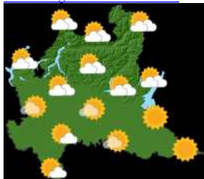
VENERDI' 05 LUGLIO

Previsioni della rete meteorologica regionale: https://www.arpalombardia.it/temi-ambientali/meteo-e-clima/bollettini-meteorologici/meteo-lombardia/