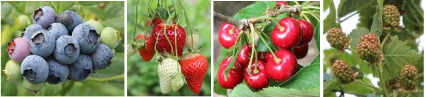
Fig. 2. Da sinistra: Mirtillo a inizio maturazione, fragola a maturazione, ciliegio a maturazione, mora a ingrossamento frutti